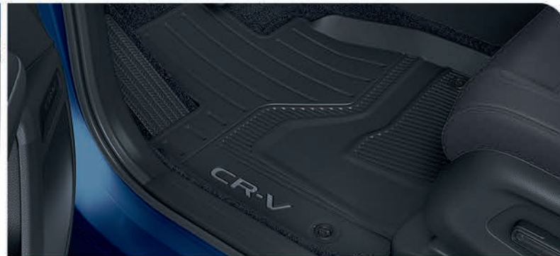
Tapetes toda temporada