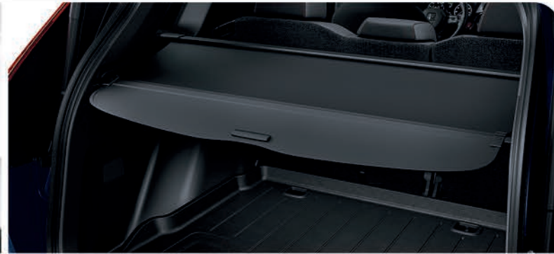
Cubierta de carga retráctil