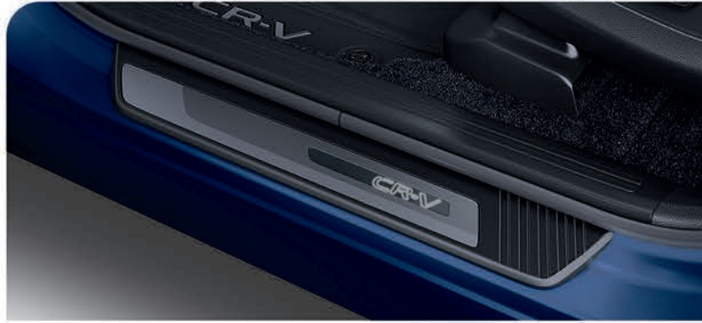
Adorno de piso de puerta iluminado