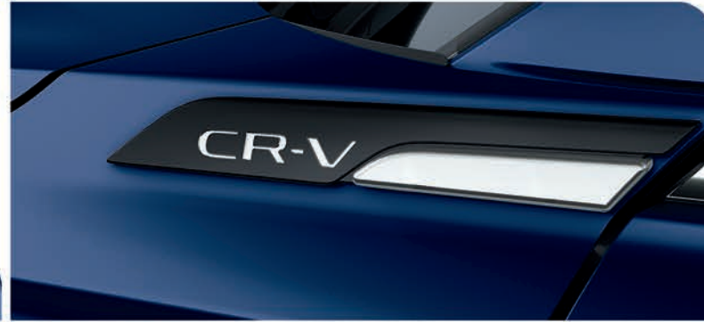
Emblemas laterales CR-V