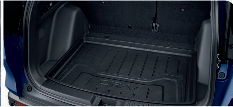
Bandeja de carga